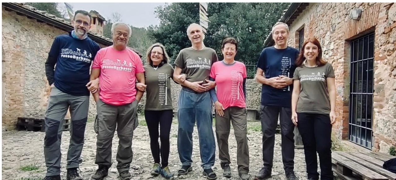
Le prime magliette stampate su modelli reali nei colori blu scuro - fucsia - verde militare.