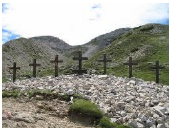
le sette croci

I percorso è molto verde, selvaggio , si attraverserà una cava abbandonata e si arriverà dopo circa 4 ore alla località sette croci ( quota 2000 m. ) da cui si avrà ampia visuale della zona sacra del monte Pasubio. Si proseguirà fino a raggiungere dopo circa 2 ore il rifugio Lancia (quota 1825 m.) dove ci fermeremo per la cena e il pernottamento.