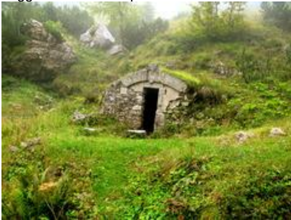
sorgente acque fredde in val sorapache

Si prosegue in direzione Cima Palon 2232 m. s. massima elevazione del Pasubio altro luogo di difesa Italiano . Si prosegue il cammino verso il Rif. A. Papa, dove avremo la possibilità di ristorarci. Da lì scenderemo a contrà Doppio ( arrivo previsto ore 16 ) attraverso la suggestiva Val Sorapache.