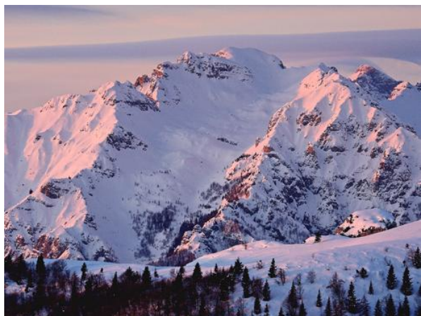
Immagini della val caprara

I percorso è molto verde, selvaggio , si attraverserà una cava abbandonata e si arriverà dopo circa 4 ore alla località sette croci ( quota 2000 m. ) da cui si avrà ampia visuale della zona sacra del monte Pasubio. Si proseguirà fino a raggiungere dopo circa 2 ore il rifugio Lancia (quota 1825 m.) dove ci fermeremo per la cena e il pernottamento.