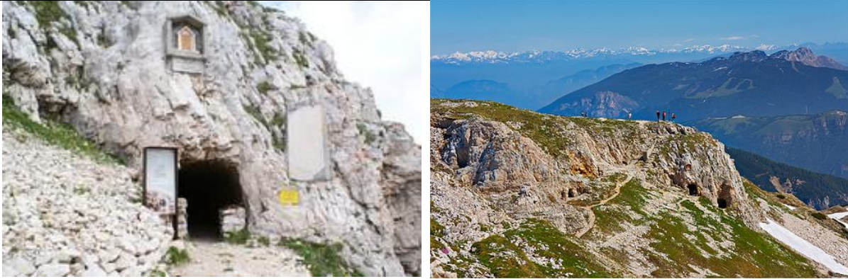
Immagini dei denti italiano e austriaco

Si prosegue in direzione Cima Palon 2232 m. s. massima elevazione del Pasubio altro luogo di difesa Italiano . Si prosegue il cammino verso il Rif. A. Papa, dove avremo la possibilità di ristorarci. Da lì scenderemo a contrà Doppio ( arrivo previsto ore 16 ) attraverso la suggestiva Val Sorapache.